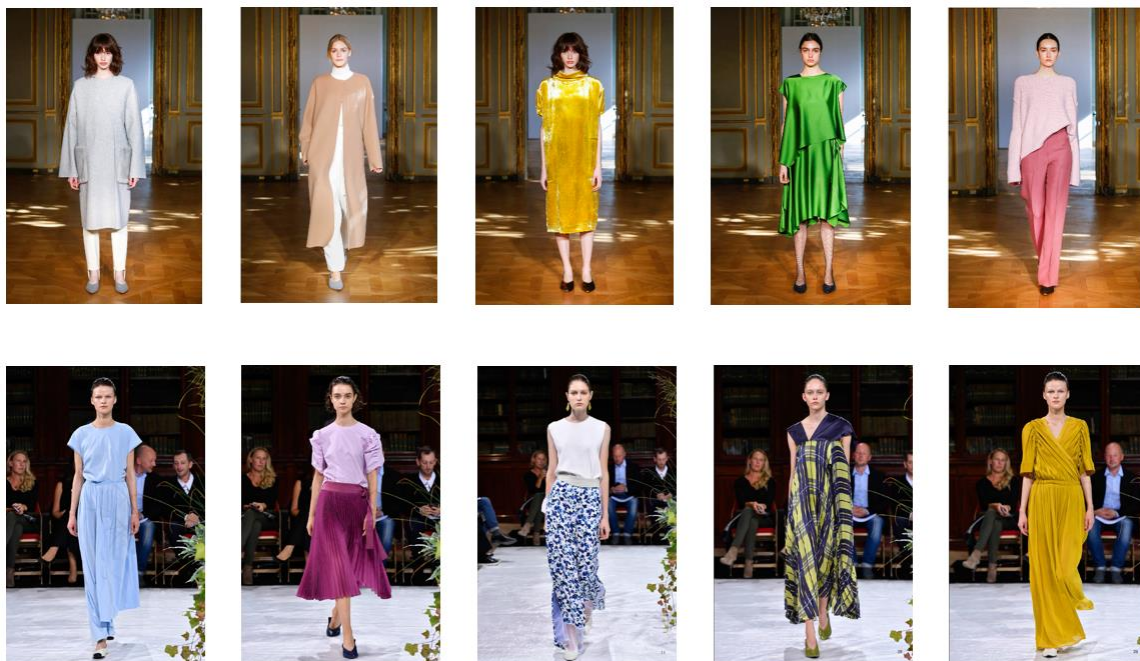
「CYCLAS」2017 年秋冬コレクション（上段）、2018 年春夏コレクション（下段）

2016 年秋冬シーズンには、パリで展示会を行い海外への卸を開始、NY の「バーグドルフグッドマン」他、世界のトップリテイラーで展開されているグローバルブランド。その後、パリファッションウィークで継続的なプレゼンテーションを行い、実績を重ねています。