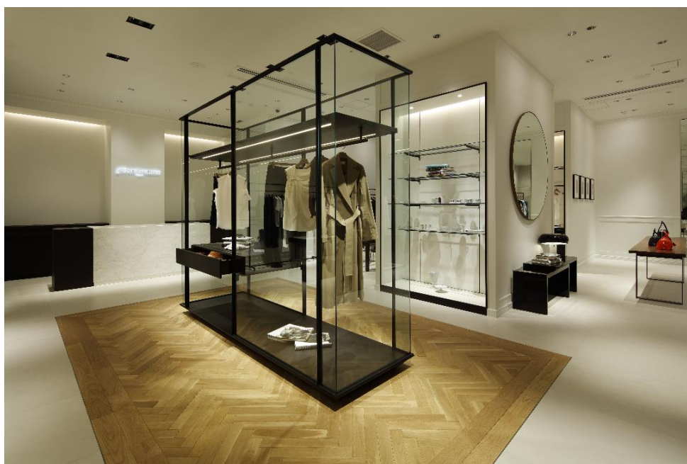
「ザ シークレットクロゼット」名古屋店